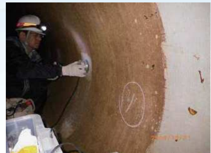
管内での測定状況の例

・PC 鋼線の発錆・破断測定から、PC 鋼線の健全性（発錆・破断の有無）を確認します。