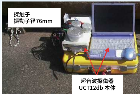
PC管用に改良した 広帯域超音波探傷器

・超音波部材厚測定から、カバーコートの残存部材厚を測定して劣化（薄肉化）の度合いを把握します。