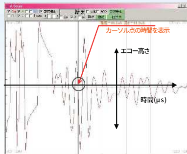
部材厚測定の場合 (波形データ)