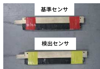
PC鋼線破断測定用センサ