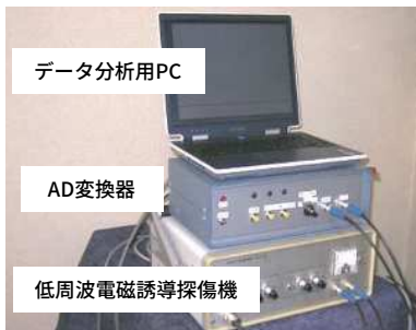
低周波電磁誘導探傷器

・PC 鋼線の発錆・破断測定から、PC 鋼線の健全性（発錆・破断の有無）を確認します。