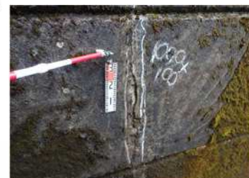
変状の詳細は記録として整理