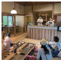
気仙沼 まちなかエリア (神明崎)